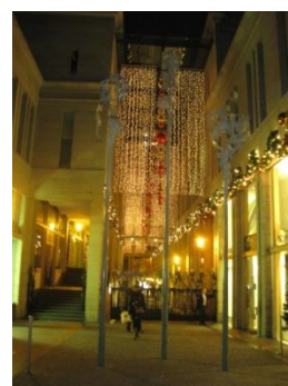
✓ Rustig kleurbeeld