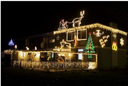
✗ Overdadige verlichting