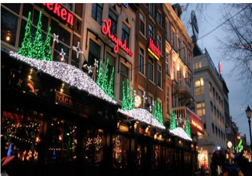
✗ Bonte kleuren overheersen