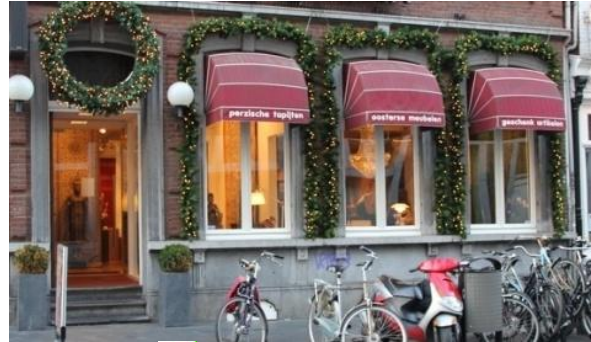
✓ Herkenbare architectuur