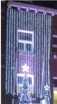
✗ Verhullende verlichting